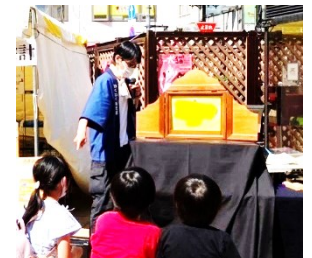
古本まつりには毎年参加！