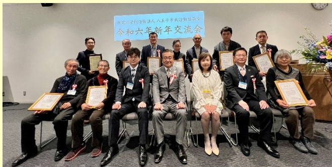
感謝状贈呈の方々と来賓との記念撮影

会場には、元旦に発生した能登半島地震への募金箱を設置し、短時間にもかかわらず多くの方にご協力いただきました。みなさま、ありがとうございました。