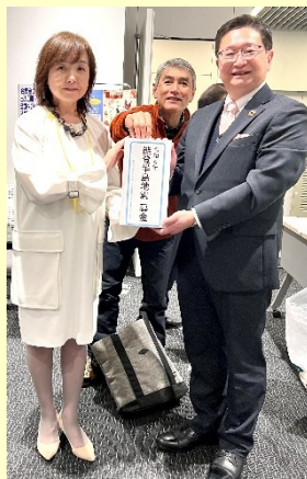
当日集まった募金を社会福祉協議会に渡しました