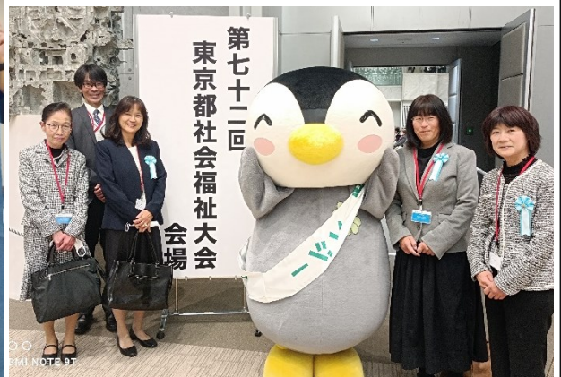
都庁にて感謝状をいただきました