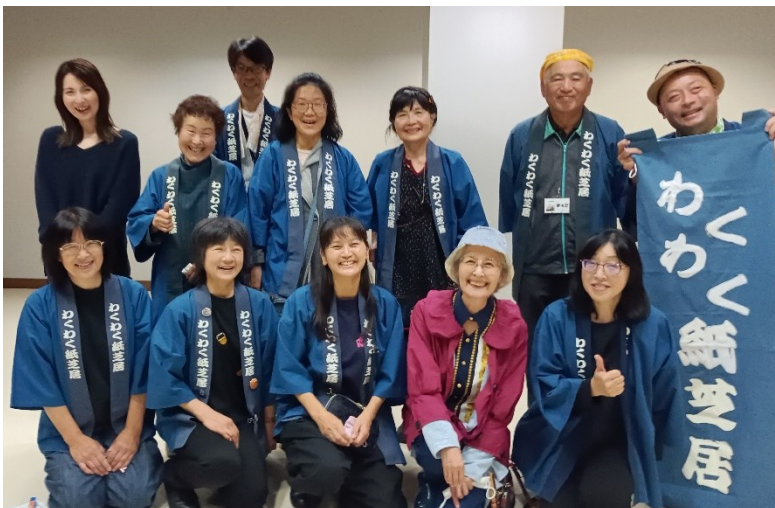
20周年記念イベント 講師を囲んで