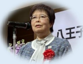
八王子市副市長 木内基容子氏