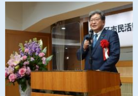
衆議院議員 萩生田光一氏