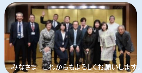
みなさま これからもよろしくお祈りします。