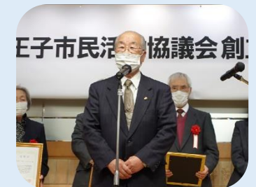
NPO 法人八王子レクリエーション協会 様