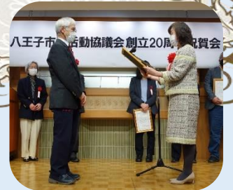
八王子センター元気 様