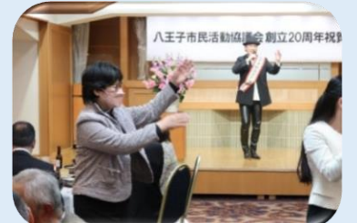
富永氏の歌「太陽おどり」で踊ります