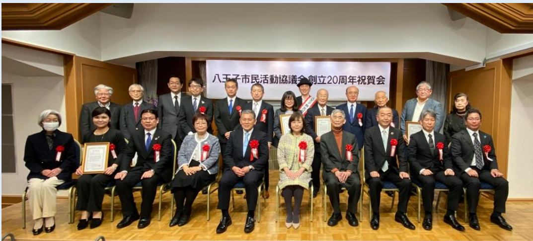
第1部 創立20周年記念式典表彰者と来賓の方々