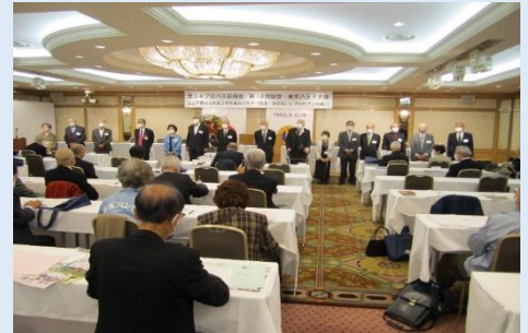
2022.11月、全日本プロバス協議会第10回全国大会