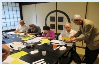
俳句同好会・句会の様子